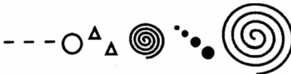
Образец графической партитуры

Различные графические партитуры могут быть предложены в качестве вариантов. Любое звуковое воплощение их будет правильным, так как в этом задании важно развивать воображение и ассоциативное мышление.